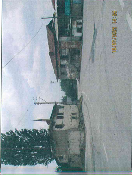
TAŞPINAR MAHALLESİ 190732 ADA 1 PARSEL METRUK YAPI FOTOĞRAFLARI